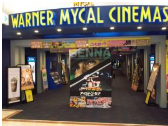
ワーナー・マイカル・シネマズ鈴鹿ベルシティ