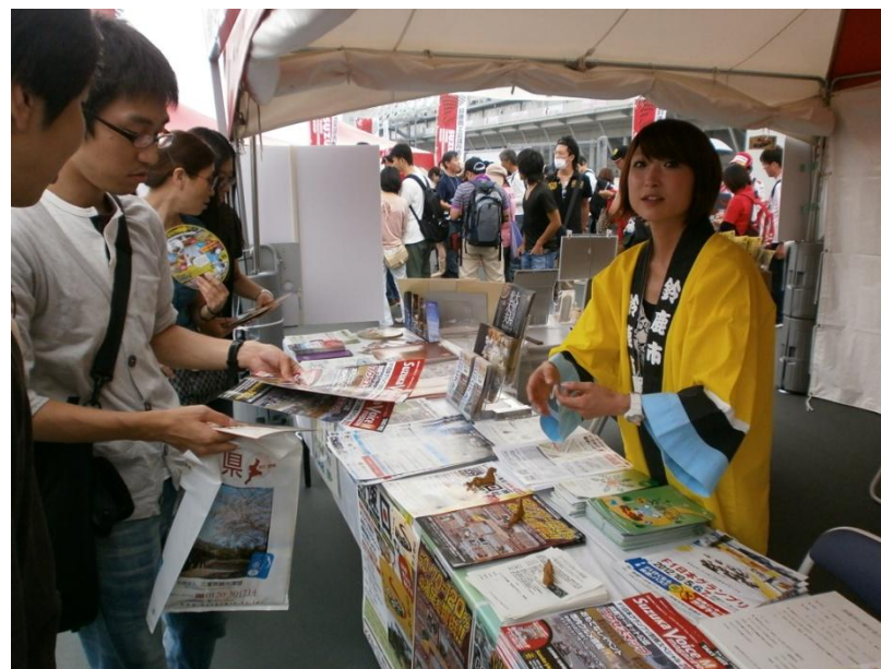
三重県・5市1町観光・物産PRブースにて3,000部を配布