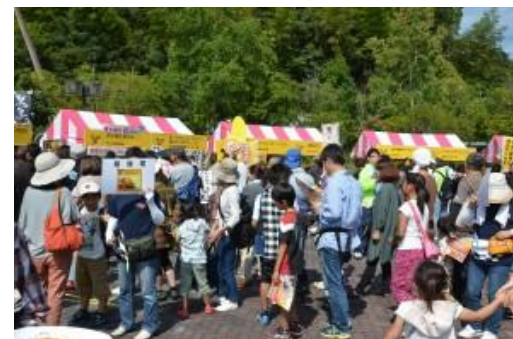
鈴カレーグランプリ