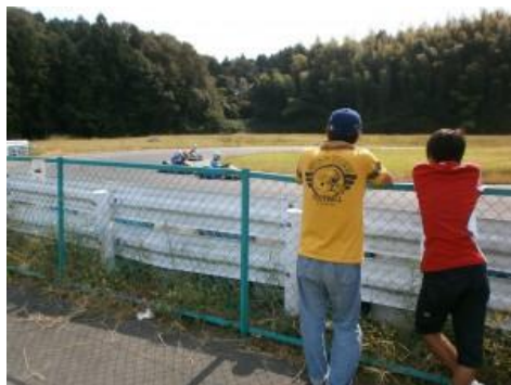
レーシングカート体験