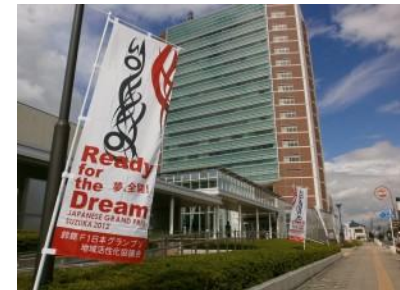
のぼり旗(鈴鹿市役所周辺)