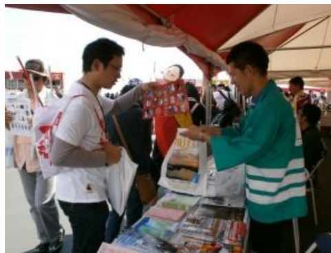
観光パンフレットの配布