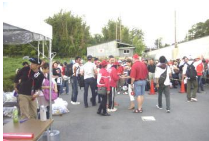
インフォメーションブース 伊勢鉄道鈴鹿サーキット稲生駅