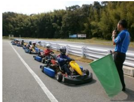
レーシングカート体験