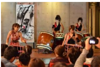
和太鼓凜ライブコンサート