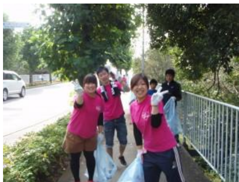
クリーンアップ大作戦