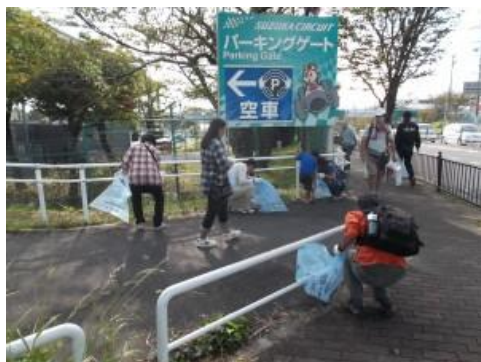
クリーンアップ大作戦