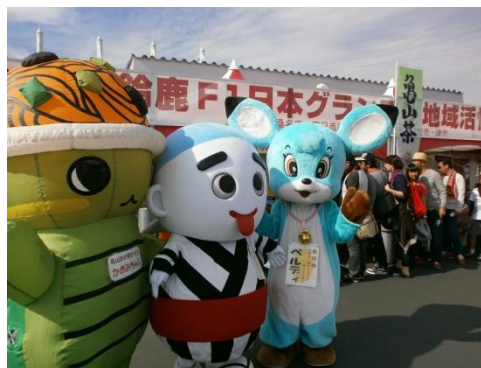
ご当地キャラクターの登場