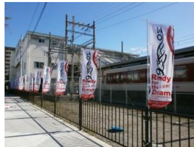
のぼり旗(近鉄白子駅前)