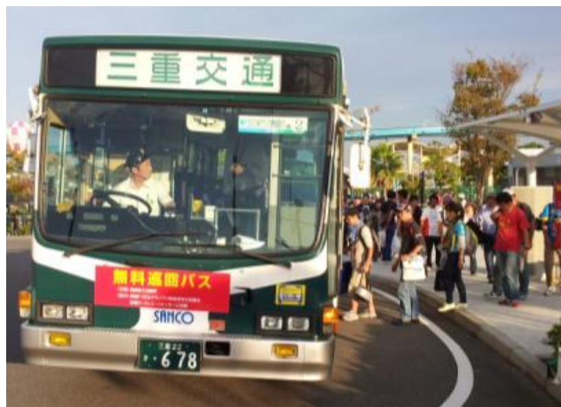
夜間市内無料巡回バス(鈴鹿サーキット乗り場)

6日(土) 16:00~21:00 16便 利用者数延べ552人 合計延べ966人