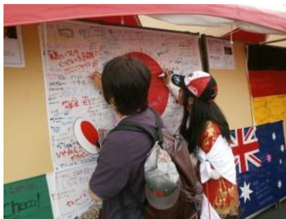
メッセージオトドケ隊