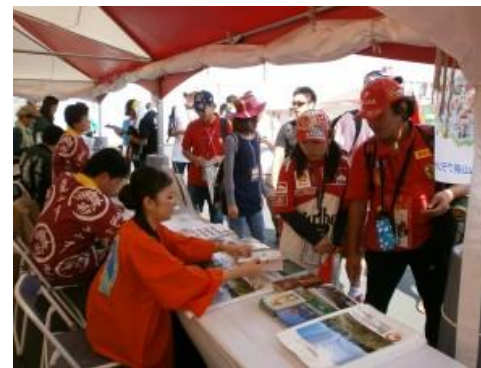
観光パンフレットの配布