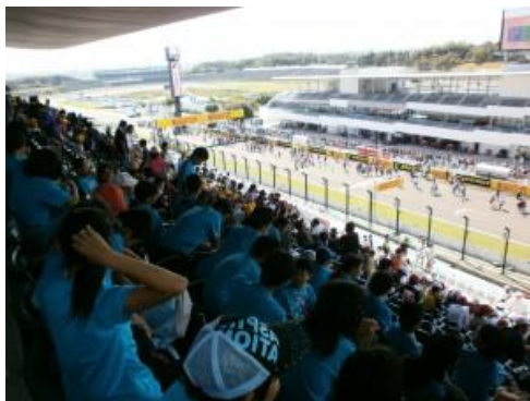
グランドスタンド