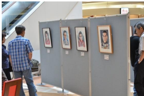
F1ドライバース'顔展