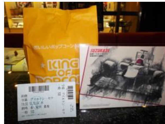
特典:ミニポップコーン&オリジナルポストカード