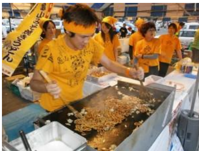
第6回三重県ご当地グルメ大会