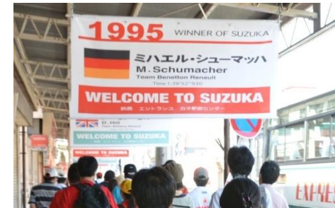
歴代優勝者タペストリー

→9/30の台風17号による大雨の影響で, 白子駅前センター商店街が 浸水したが, 白子高校剣道部が清掃作業を実施して地域の復旧に協 力していただいた。