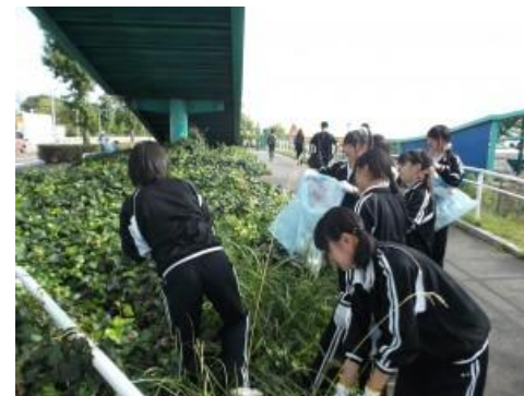
クリーンアップ大作戦