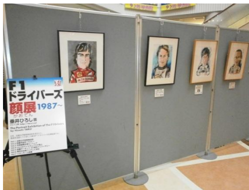
F1ドライバース'顔展