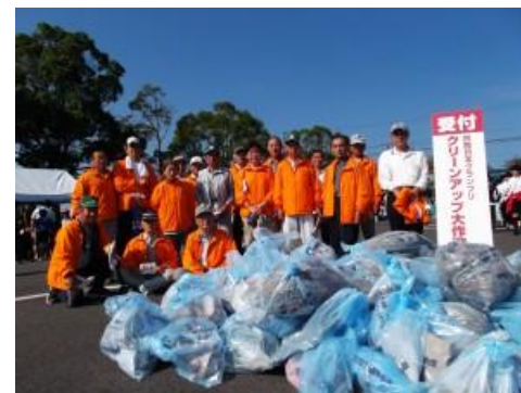
集積ゴミ(1トトラックと軽トラ各1杯分)