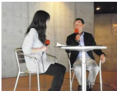
中嶋悟氏トークショー