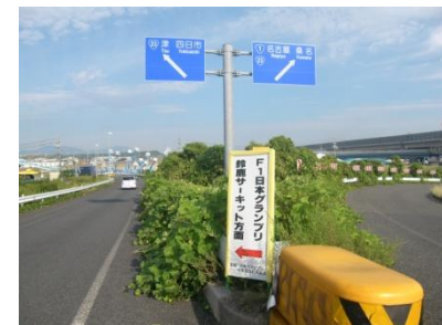
案内看板(みえ川越IC)