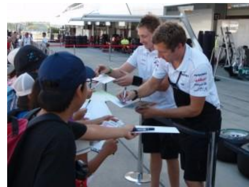
チーム関係者との交流