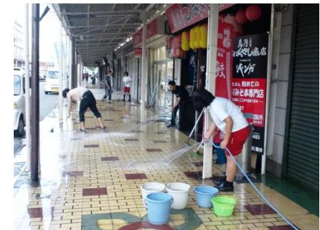
白子駅前復旧作業