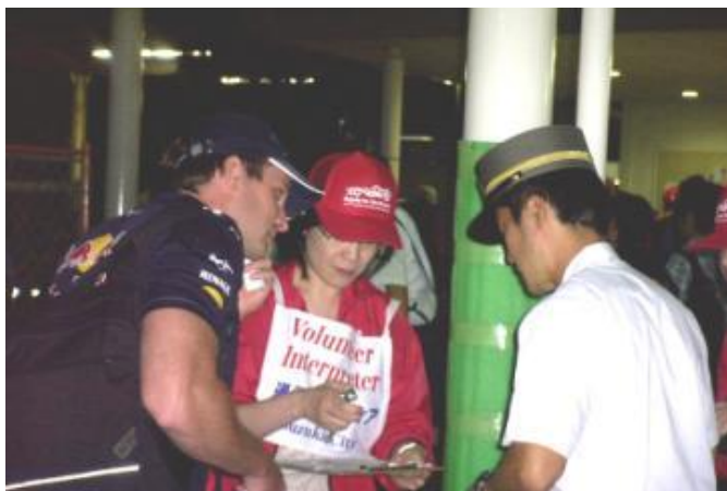
インフォメーションブース 近鉄白子駅