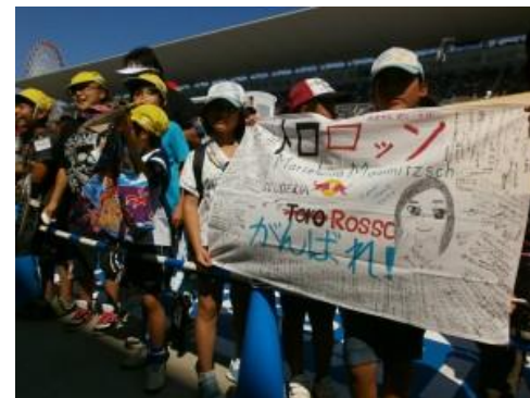
チーム応援旗のプレゼント