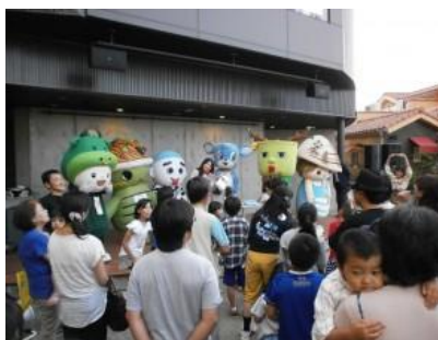
ご当地キャラクイズ大会