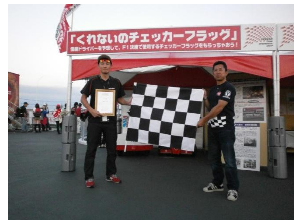
くれないのチェッカーフラッグ