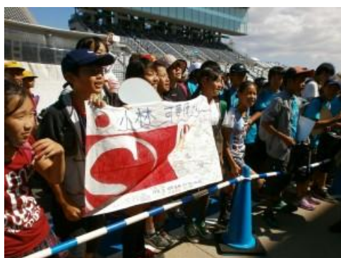
チーム応援旗のプレゼント