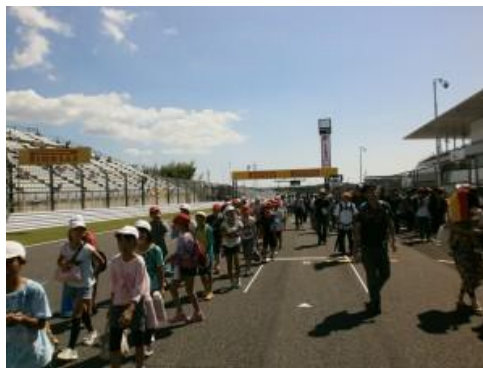
ホームストレート