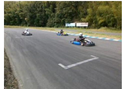
レーシングカート体験