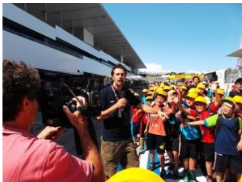
海外メディアの取材