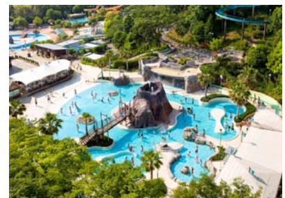
アドベンチャープール