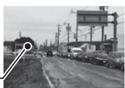
過去の動画はこちら